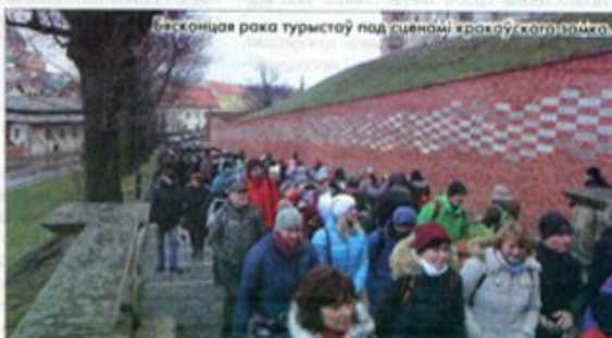
Бясконая рока турыстаў пад сцягамі крокіотскага вомка.

чоскую, італьянскую, англійскую гаворку. Вось такім было наша нейкае і завочна-візуальнае, але ўсё ж знаёмства. Мы таксама захоплены разглядалі помнікі архітэктуры і ў патаемных куточках душы марылі пра тое, што вуліцы і нашых гарадоў запоўніць натоўпы замежных турыстаў. На жаль, накуль што