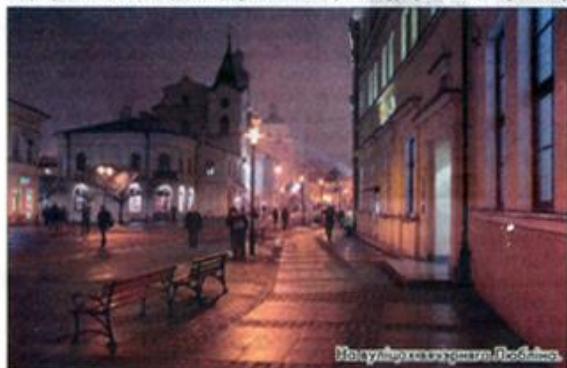
Навуліца кракаўскага Любліна.

цыі знаёмства з польскім перыядам жыцця Тадэвуша Касцюкі. Гэта невялікая, паколькі 2017 год аб'яўлены ў Польшчы годам Касцюкі, і польскі бок зацікаўлены ў распрацоўцы сумесных турыстычных маршрутаў, звязаных з імем героя дух катанентаў. Асноўнымі аб'ектамі сумесных маршрутаў, безумоўна, стануць польскі Кракаў, дзе пахаваны нацыянальны герой Беларусі і Поль-