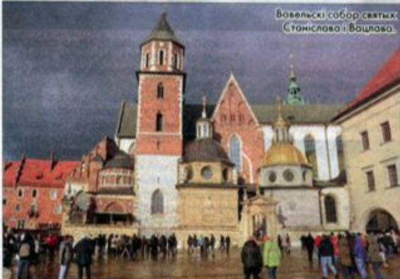
Вавельскі сабор святых Станіслава і Вацлава.